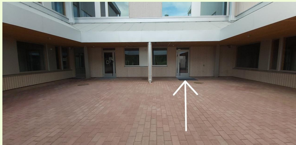
1.-2. luokkalaisten sisäänkäynti