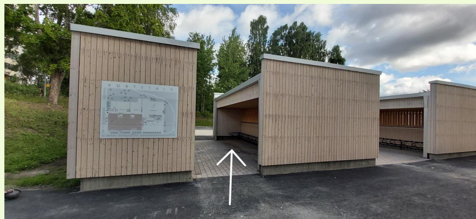
1.-2. luokkalaisten pyöräparkki

EPPULUOKKA ALKAA KESKIVIIKKONA 12.8.2026 KLO 9.15 Ensimmäinen päivä päättyy klo 12.15. Iltis aukeaa klo 12.15