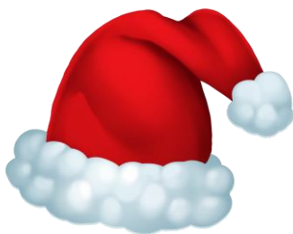
en totemössa/ en tomteluva