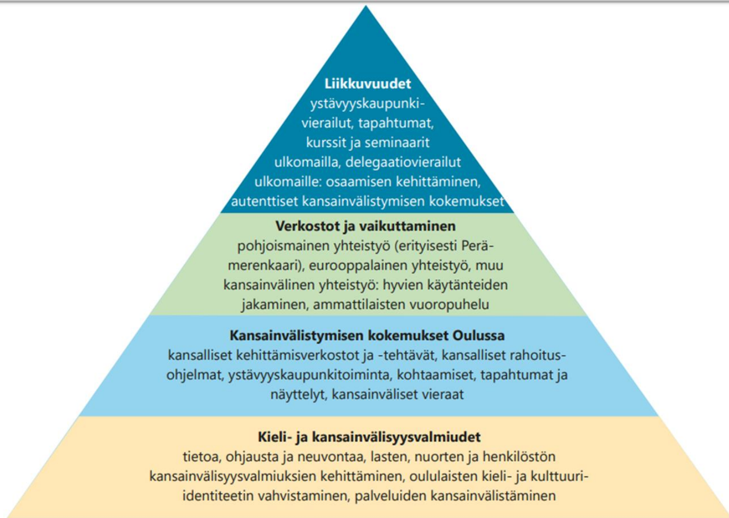
Kuva 4. Kansainvälisyyden tasot sivistys- ja kulttuuripalveluissa