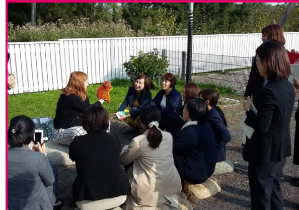
Vieraita Kiinasta Sampolan päiväkodissa syyskuussa 2019