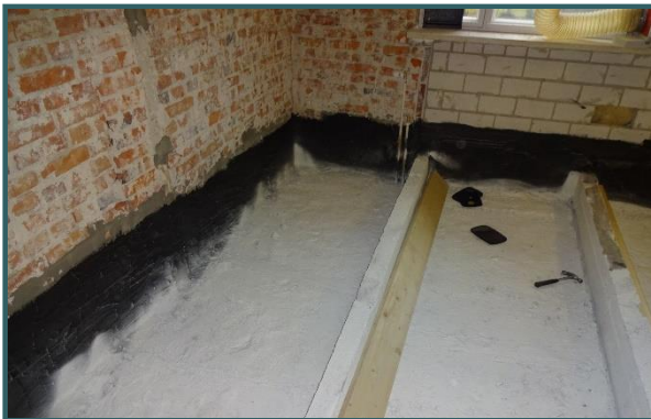
Tilan hiilihappojääkäsittelyn jälkeen läpiviennit paikattiin ja tiivistettiin, lattian ja seinän raja tiivistettiin ja lattiapinta pölynsidottiin.

Luokan 1045 (allaskaapin vesivahinko) kosteusmittaukset tehdään seuraavan kerran viikon 45 alussa, jolloin saadaan aikataulua vahinkoalueen takaisinrakennukselle. Luokkien allaskaappien lattioiden ja seinien pintakosteusmittaukset saadaan samoin päätökseen viikon 45 aikana.