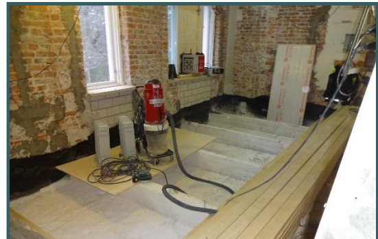
Lattian pohjarakenteiden teko on aloitettu. Seinät tasoitetaan ja tiivistetään lattiarungon päältä.