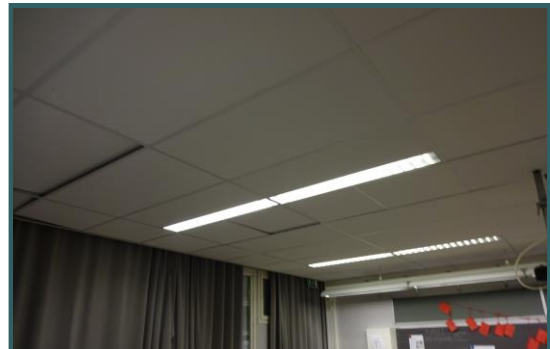
Joululomalla aloitetaan Aapiskukon kattoakustojen vaihto.