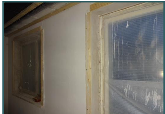
Kun tiivistykset on saatu valmiiksi, merkkiainekokeilla varmistetaan niiden pitävyyttä.