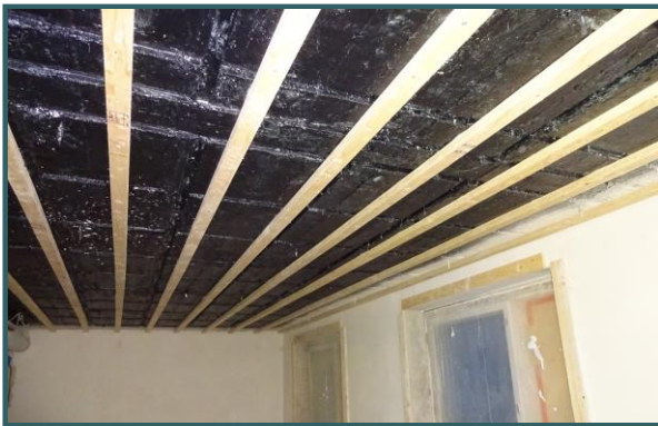
Kertopuukoolaus ristinkoolataan laudalla ennen palo- ja N-kipsilevyjen asennusta.

Joululomalla teemme Aapiskukossa alakattokorjauksia, akustolevyn vaihtoja ja höyrynsulun/läpivientien tiivistyksiä. Työ aloitetaan 3D-luokasta ja sitä jatketaan aikataulun puitteissa luokkatila kerrallaan. Työtä jatketaan tarvittaessa hiihtolomalla. Koko korjaustyön ajan työporukan mukana kulkee Siivousliike Nybergin puhdistusryhmä, joka puhdistaa avatut akustokattojen läpuolet ja työalueet rakennustöiden tahtiin.