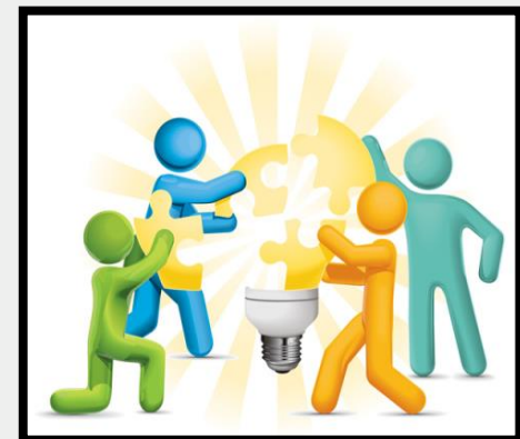
6 Johtajuus, valta