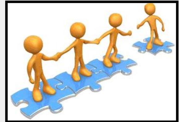
3 Yhteenkuuluvuus (= kiinteys, koheesio)