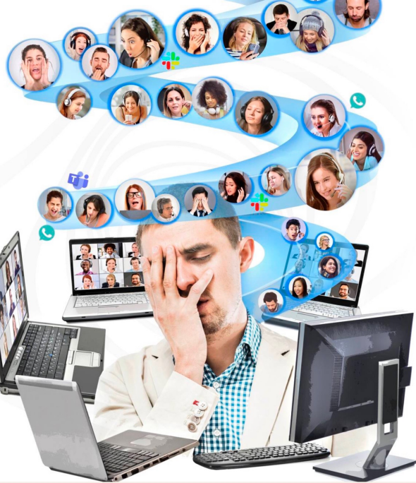
Lukijoiden kokemusten perusteella työpaikoilla on epäselvyyttä varsinkin siinä, mitä asioita missäkin sovelluks

Korona-aika ei heidän mukaansa ole vaikuttanut 30 vuotta kestävään ystävyssuhteeseen mutta yhteydenpitoon on.