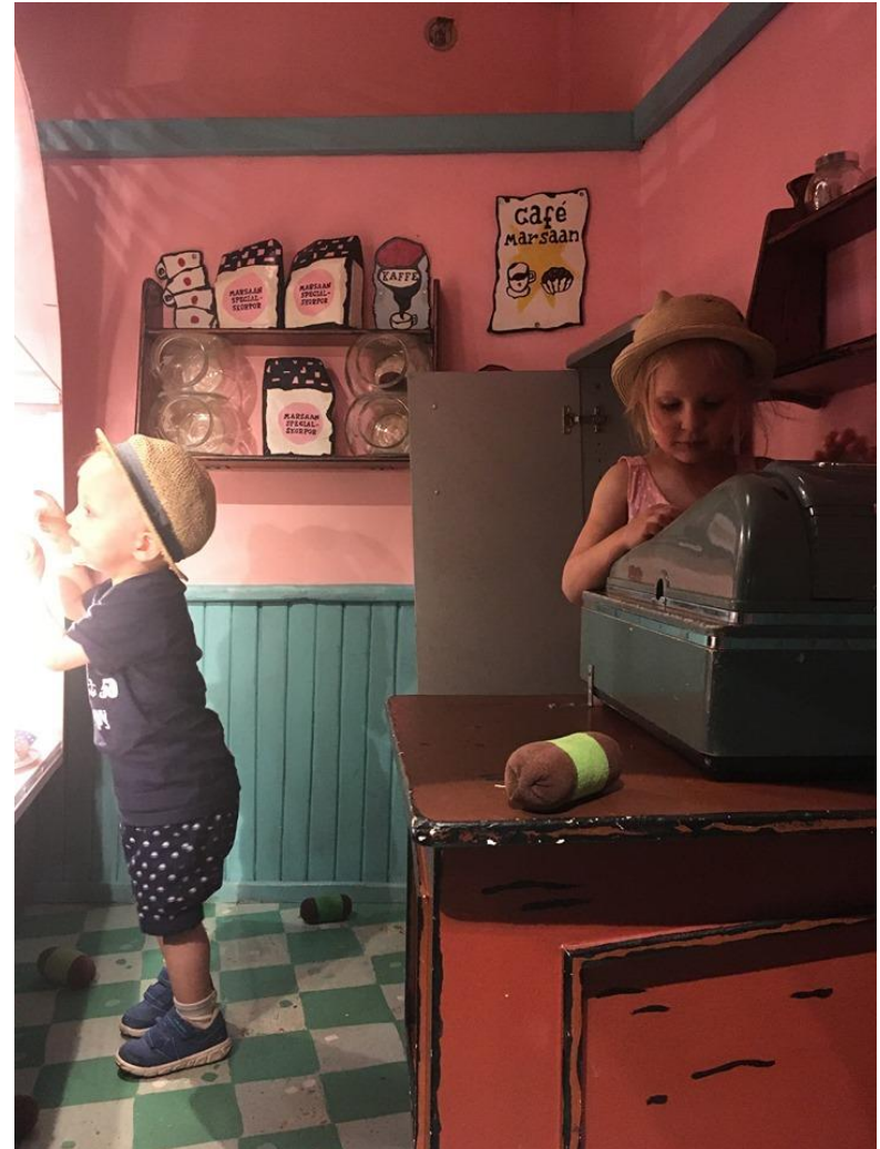
Lassen ja Maijan etsivätoimisto. Junibacken, Tukholma.