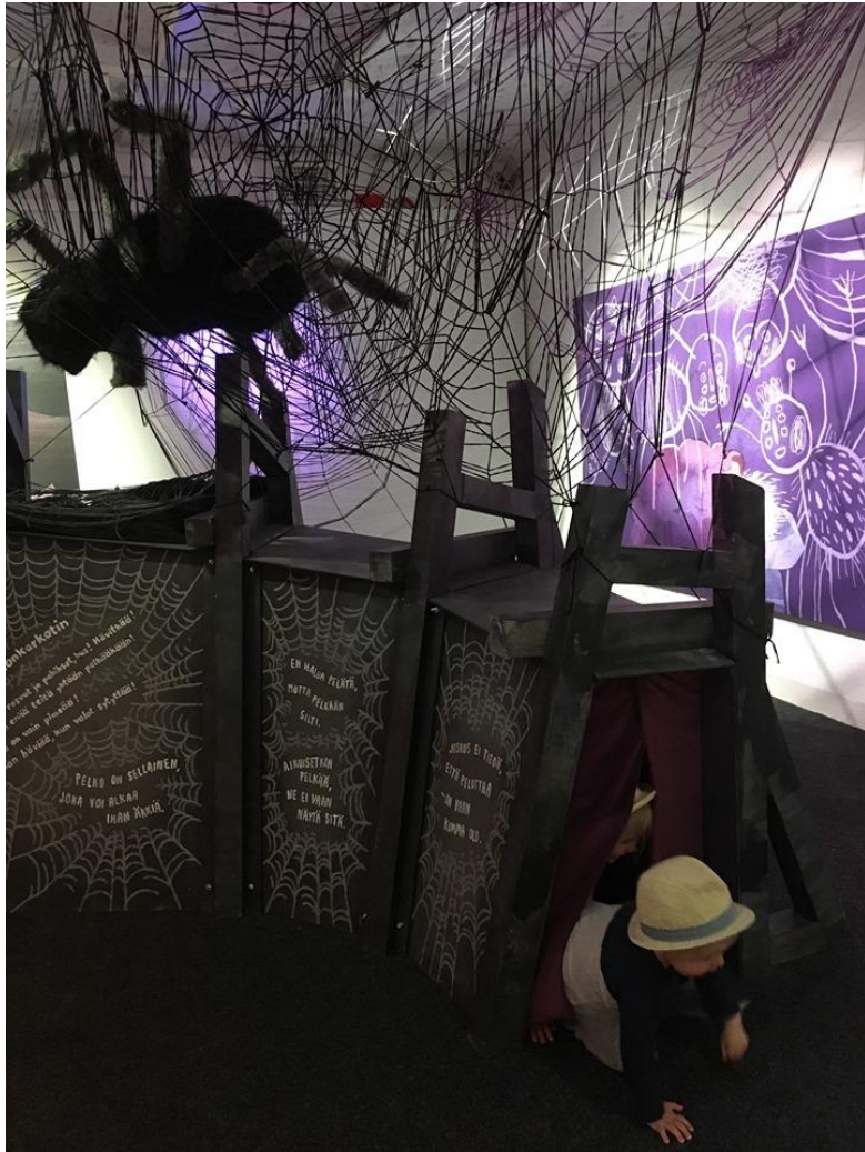
Valveen Sanataidekoulun näyttely, Oulu.