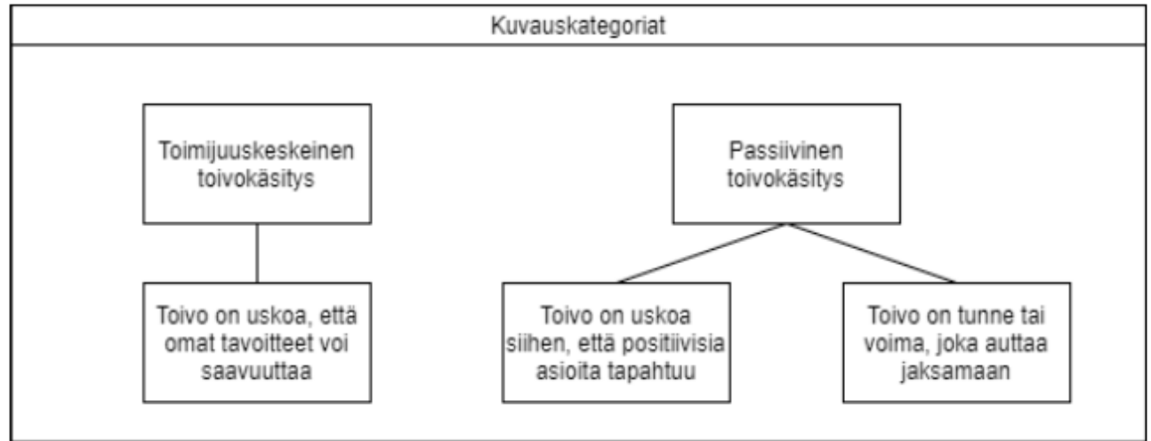
Kaavio 2. Kuvauskategoriat selityksineen ja alakategorioineen.