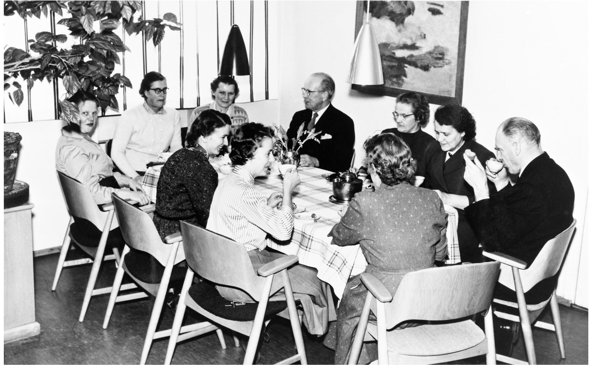
OPETTAJAT KAHVIPOYDASSA. VALLILAN RUOTSINKIELINEN KANSAKOULU.