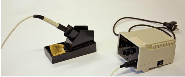
JUOTIN JA JUOTINASEMA