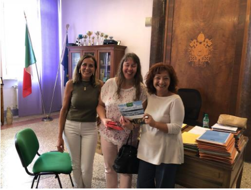
englanninopettaja, minä ja rehtori

liian iso myös opettajan mielestä. Opiskelijat voivat valita mm. kuvanveistoa ja grafiikkaa, tämä on ainut lukio lähiseudulla jossa litografiikan painokone. Myös näyttelemistä ja body language -taitoja opetetaan, osa sisällöistä vapaaehtoisissa kerhoissa, jotka kokoontuvat varsinaisen koulupäivän jälkeen. Rehtorin kanssa keskustellessa hän korosti sitä, kuinka ikävää nykyään on Italian kouluissa, kun vain kokeilla ja tuloksilla on merkitystä, opiskelijan pitäisi saavuttaa valtion asettamat pistemäärät, mutta jos nuoren kapasiteetti ei riitä, niin oikein mitään apukeinoja ei tähän tilanteeseen ole tarjolla.