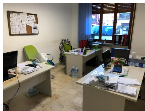
Project Design –osaston väki ja minä