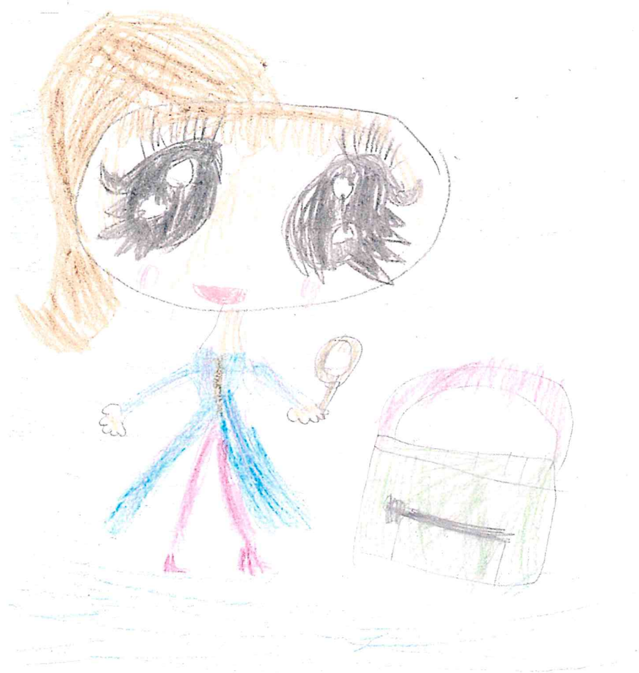
Kuva: 1-2 luokkalaisen piirustus, unelmien koulussa voisi olla etsivätoimisto, jossa voi tutkia salaisia juttuja.