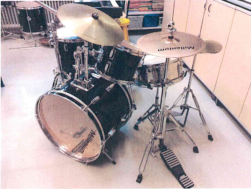
Kuva 3-4 luokka: Rummuilla soittelu koettiin mukavaksi 3-4 luokkalaisten keskuudessa.

Kuvista voi päätellä, että rummuilla soittelu on mukavaa, liikunta-alueet ovat mieluisia ja sekä oman koulun pieni kirjasto. Ilmeisen mukavaa on myös koulupäivän loppuminen ja kotiin lähtö.