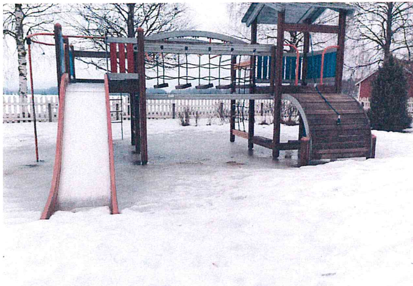
Kuva 1-2 luokka: kiipeilyteline koettiin mieluisaksi paikaksi Kuuman koulussa.

Oppilaat ottivat yhteensä kuusi kuvaa koulusta. Kaksi kuvaa otettiin kiipeilytelineestä. Yksittäisiä kuvia otettiin jalkapallokaukalosta, piha-alueen aidan yksityiskohdasta (sammalkuvio), oman luokan lukunurkkauksesta sekä työskentelystä i padin kanssa.