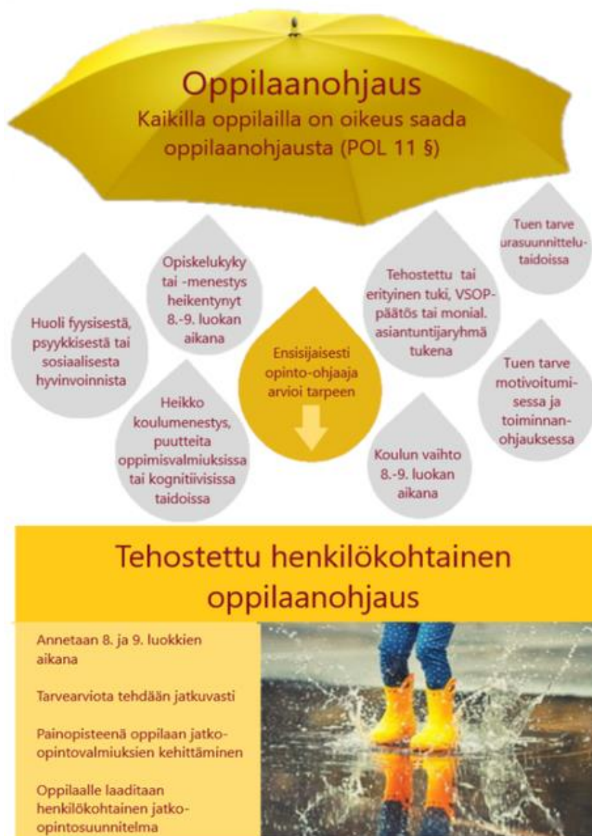
Kuva 3. Oppilaanohjaus ja tehostettuun oppilaanohjaukseen siirtyminen.

Ohjauksen sisältö ja toteutus laaditaan yksilöllisten lähtökohtien ja tarpeiden pohjalta, joten tehostettu henkilökohtainen oppilaanohjaus voi tarkoittaa eri oppilaille eri ohjauksen muotoja. Oppilas saa henkilökohtaista ja tarpeen mukaan myös pienryhmäohjausta keskimääräistä useammin. Tehostetussa henkilökohtaisessa oppilaanohjauksessa edetään henkilökohtaisen jatko-opintosuunnitelman mukaan, ja siihen voi sisältyä esimerkiksi tutustumista jatko-opintopaikkoihin, useampia TET-jaksoja, moniammatillista yhteistyötä sekä tiivistä yhteistyötä huoltajien kanssa.