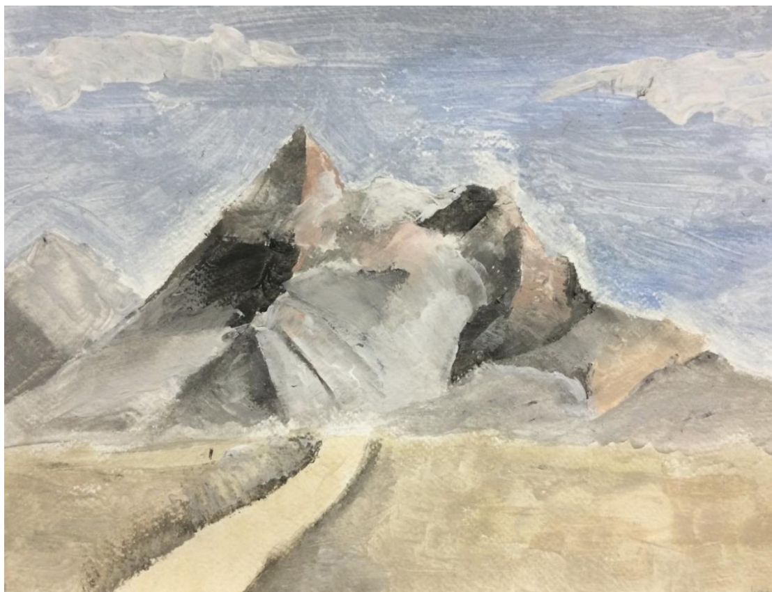
Kuva: Iina Könönen (8A), 2022