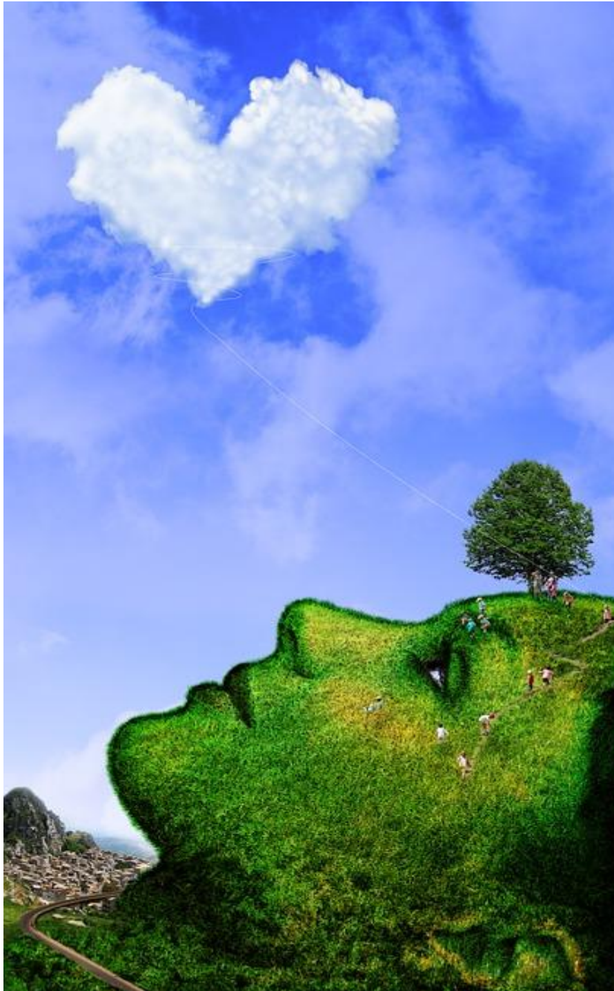
Joensuun seudun ops2016