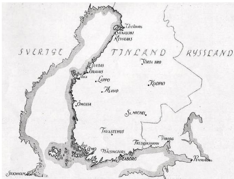
Suomi Suomen sodan aikaan. Kartalla näkyvät merkittävimmät taistelupaikkakunnat.