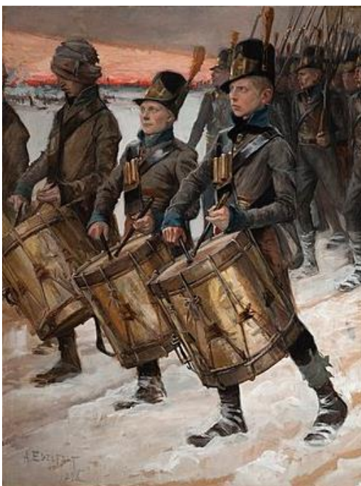
Albert Edelfelt: Porilaisten marssi (1892)

seuraus; seurata autonominen asema, autonomia maanviljelys, teollistuminen vaurastuminen vilkas - vilkkaampi - vilkkein