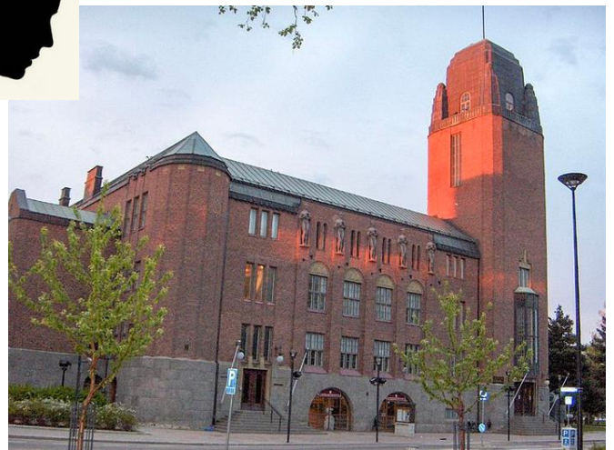
Joensuun kaupungintalo (1914) edustaa kansallisromantiikkaa.

Charlotte Brontën romaani Jane Eyre (1847; suom. Kotiopettajattaren romaani) on romantiikan ajan teos.