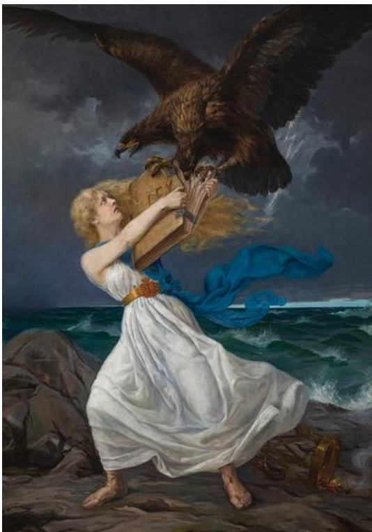
Eetu Isto: Hyökkäys (1899)

venäläistämisen + toimet (<venäläistäminen)