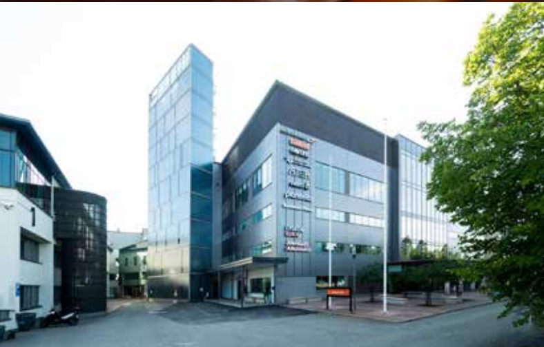
Joensuun Aikuislukio, Länsikatu 15, 80110 Joensuu