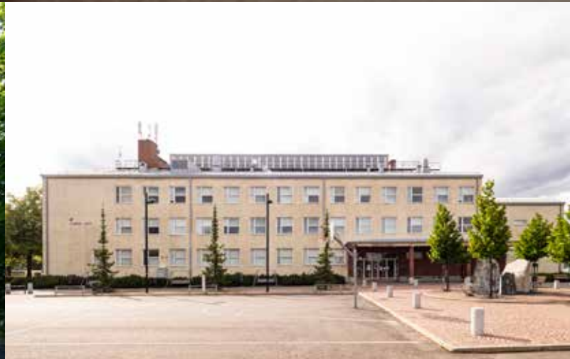
Joensuun Aikuislukio, Koskikatu 8, 80100 Joensuu