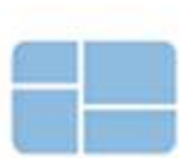
Windows 1 1985