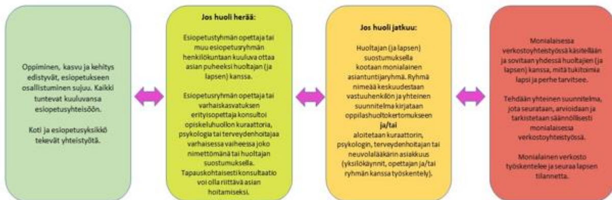
Kuvio 4. Opiskeluhoollollinen polku Jämsän esiopetuksessa

Jos huoli on akuutti, tehdään yhteydenotto sosiaalihuoltoon tuen tarpeen arvioimiseksi, lastensuojeluilmoitus ja/tai yhteys poliisiin. Lastensuojelua ja poliisia voi myös konsultoida nimettömästi. Jos yhteydenottoa ei ole mahdollista tehdä yhdessä perheen kanssa, on huoltajalle (ja lapselle) annettava tieto yhteydenotosta ja mahdollisuus keskustella yhteydenottoon liittyvistä syistä.