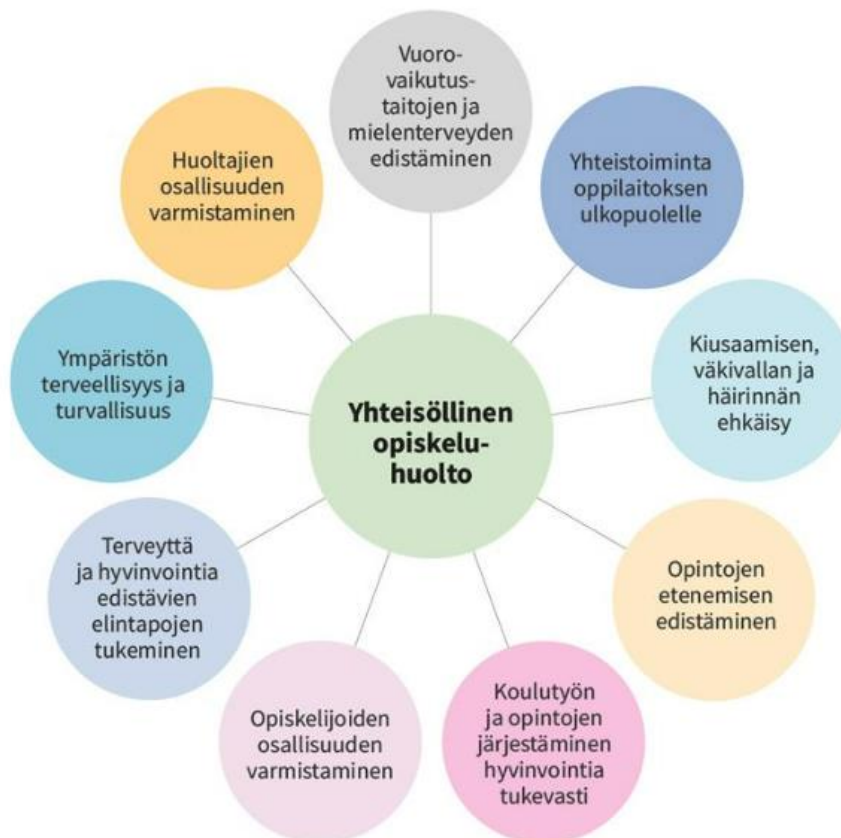
Kuvio 3. Yhteisöllisen opiskeluhoilto sisältoalueita (Terveyden ja hyvinvoinnin laitos 2022)

Yhteisöllisen opiskeluhoilutyön osa-alueita ovat mm. lasten vuorovaikutustaitojen ja mielenterveyden edistäminen, kiusaamisen, väkivallan ja häirinnän ehkäisy, oppimisen etenemisen edistäminen, esiopetuksen järjestäminen hyvinvointia tukevasti, lasten osallisuuden vahvistaminen, terveyttä ja hyvinvointia edistävien elintapojen tukeminen, ympäristön terveellisyys ja turvallisuus, yhteistoiminta esiopetusyksikön ulkopuolisten tahojen kanssa (srk, järjestöt, erikoissairaanhoido, sosiaalitoimi, poliisi) sekä huoltajien osallisuuden vahvistaminen.