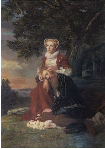
Erik XIV ja Kaarina Maununtytär