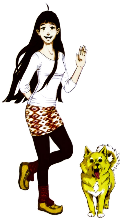
Ánne ja Dielku-beana