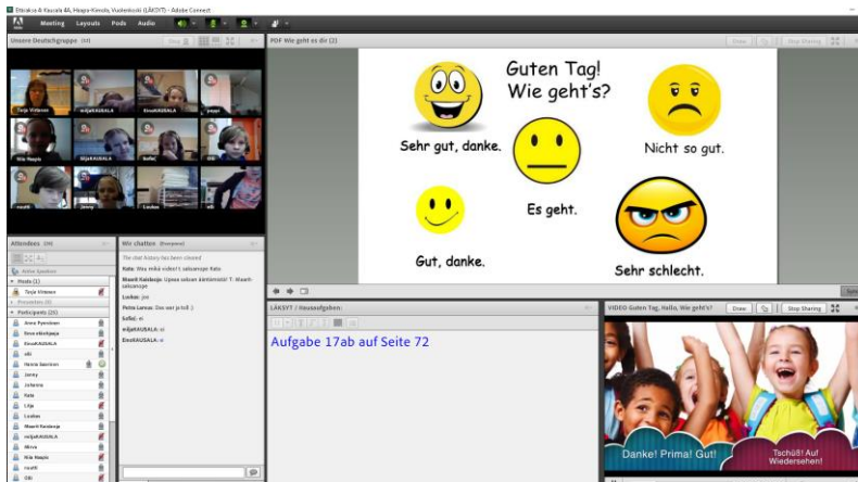
Kuvakaappaus Adobe Connect -etäopetuslustasta.