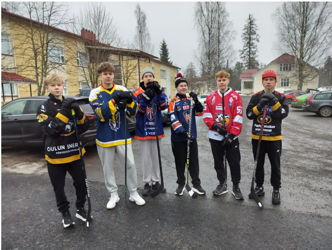
Keväällä pidettiin lukion ja Sedun opiskelijan kesken yhteinen liikuntapäivä