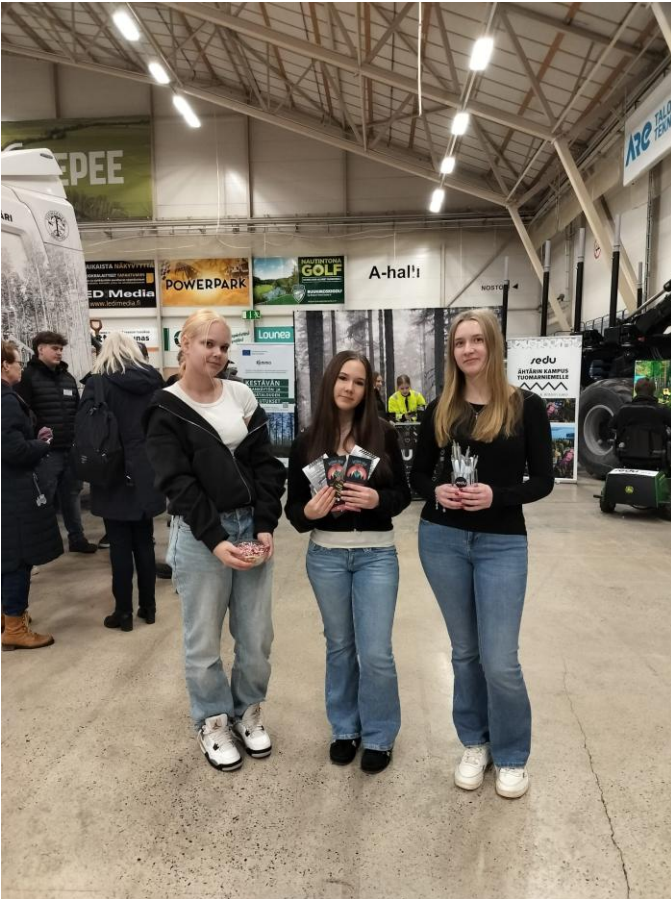
Lukio osallistui Opinlakeusmessuille