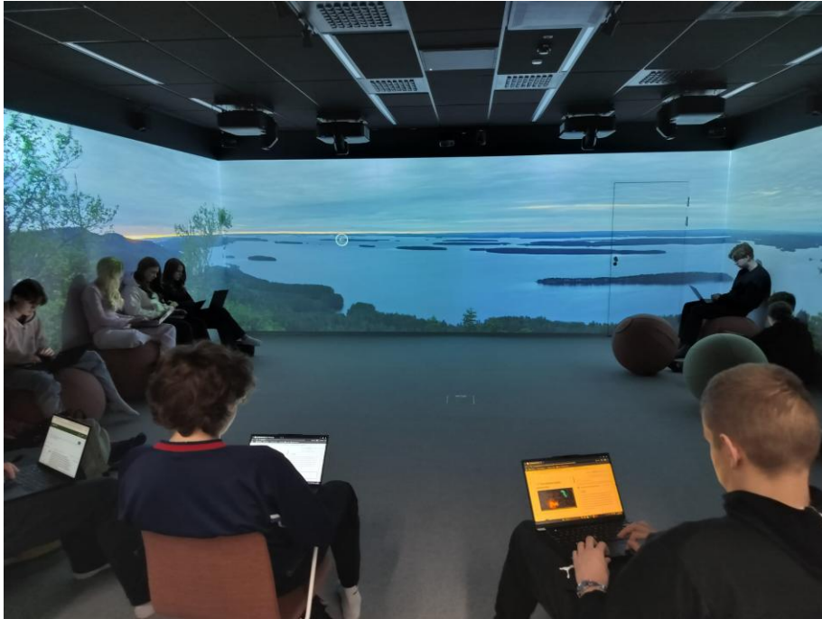
Immersiivisessä tilassa opiskelua uusissa tiloissa