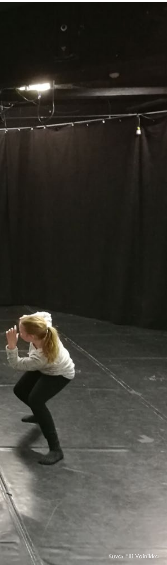
Kuva: Elli Vainikka

Opintokokonaisuus voidaan räätälöidä paikallisten tarpeiden mukaan ja opiskelijoiden mielenkiinnon kohteita kuunnellen. Kurssi antaa mahdollisuuden tarttua ajankohtaisiin aiheisiin tai ilmiöihin sekä tehdä yhteistyötä muiden taideoppilaitosten, yhdistysten ja tahojen kanssa. Opintokokonaisuuden painopiste voi olla jokin, valtakunnallisessa opetussuunnitelmassa määritelty teema tai asia esimerkiksi kestävä kehitys, kansainvälisyys tai ihmisoikeudet. Tätä muuta kurssia voidaan myös räätälöidä opiskelijalle, joka haluaa suorittaa teatteriopintojaan painotuksenaan jokin muu kuin näyttelijäntyö. Opiston resurssien puitteissa kurssi antaa opiskelijalle mahdollisuuden painottaa esim. ohjaamiseen, dramaturgiaan/käsikirjoittamiseen tai teatterin visuaaliseen puoleen.