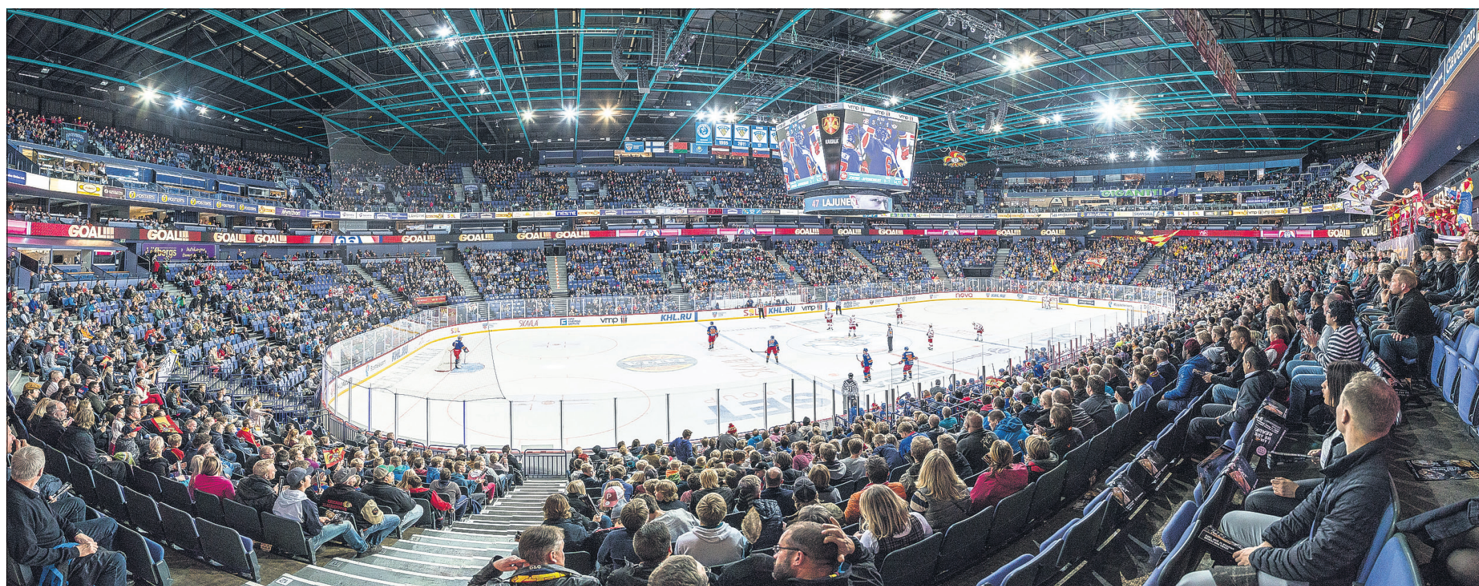
Jokereiden ja Avtomobilist Jekaterinburgin ottelussa Hartwall Arenalla salolaiset kannustivat kotijoukkuetta.

Jutun kirjoittaja ja kuvauksia ovat Hermannin koulun 9. luokan oppilaita. He ovat toimituksessa tämän viikon tet-harjoittelussa.