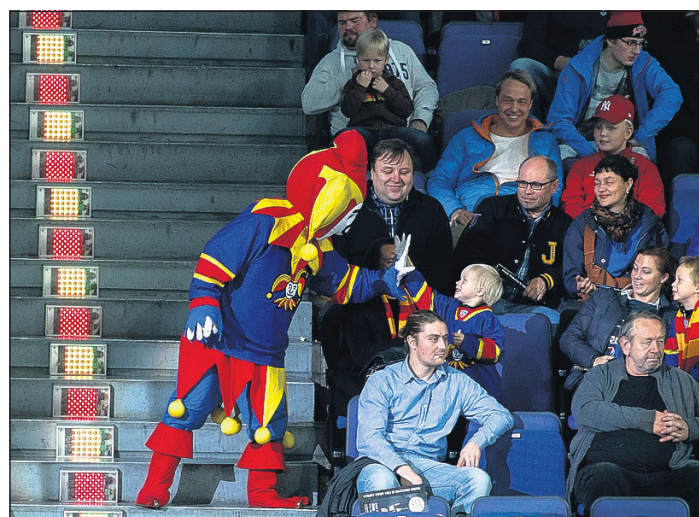
Jokereiden Otto-maskotti loit tunnelmaa yleisön joukossa.

Jotkut oppilaat lähtivät tiistain pelimatkaan jääkie-