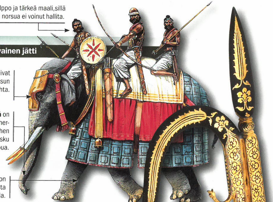
Jos norsu pillastui, ajuri joutui tappamaan sen iskemällä ankusha-keihään sen selkärankaan.

Kinnerjanteet on helppo katkaista vaikkapa miekalla.