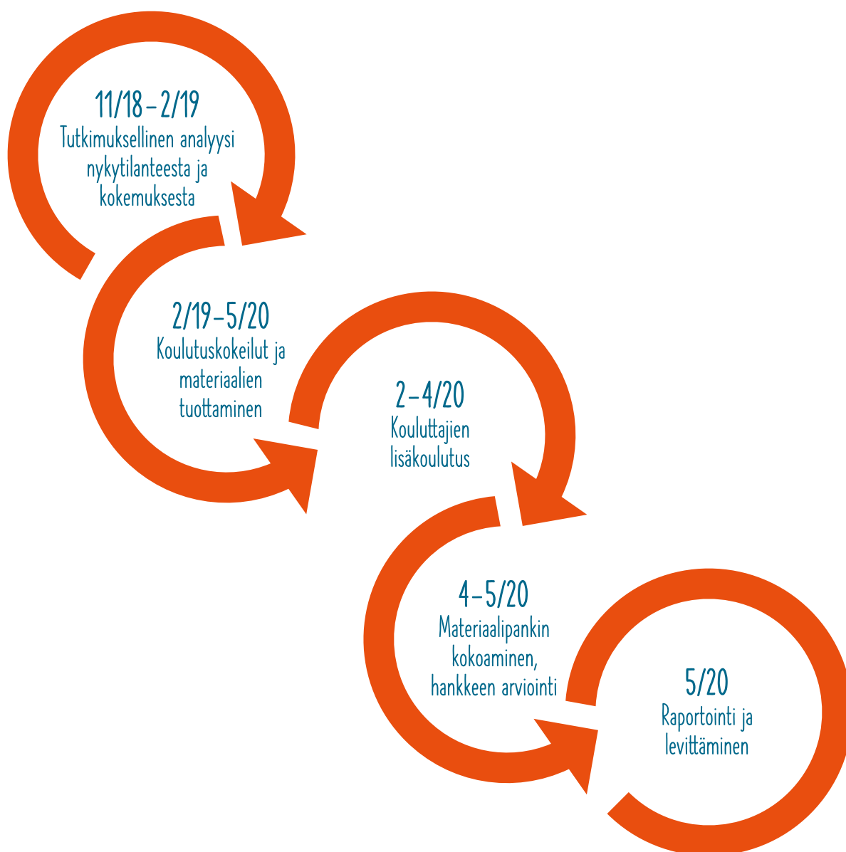
Kuva 1. ADEKA-hankkeen prosessikaavio

Hankeprosessin koko kulku on kuvattu kuvassa 1.