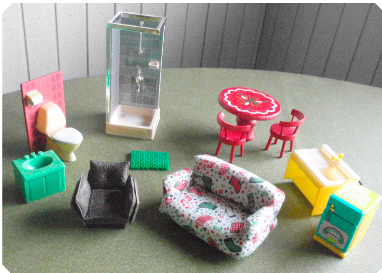
Kuva 3. Lukutaitokoulutuksessa voi hyödyntää mitä moninaisempia havainnointivälineitä. Nukkekodin kalusteet sopivat kodin sanaston ja huonekalusanojen opiskeluun.

Ks. tarkemmin hankkeen materiaalipankki -> Luku- ja kirjoitustaidottomien opetus monimenetelmäisesti