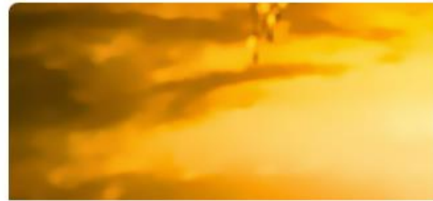
I Tavoitteena hyvä yhteiskunta (1-4)