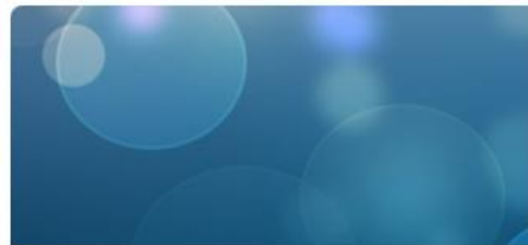
V: Vallan ja vallankäyttämisen verkostot (12-16)