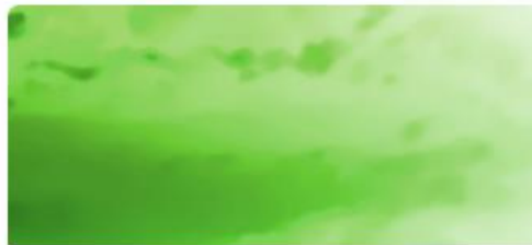
II Väestö muuttuu - Suomi muuttuu (5-7)