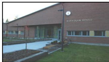
Koulu on valmistunut v. 2012

Opetus järjestetään oppilaiden ikäkauden ja edellytysten mukaisesti ja siten, että se edistää oppilaiden tervettä kasvua ja kehitystä (PoL 3 §, 2 mom).