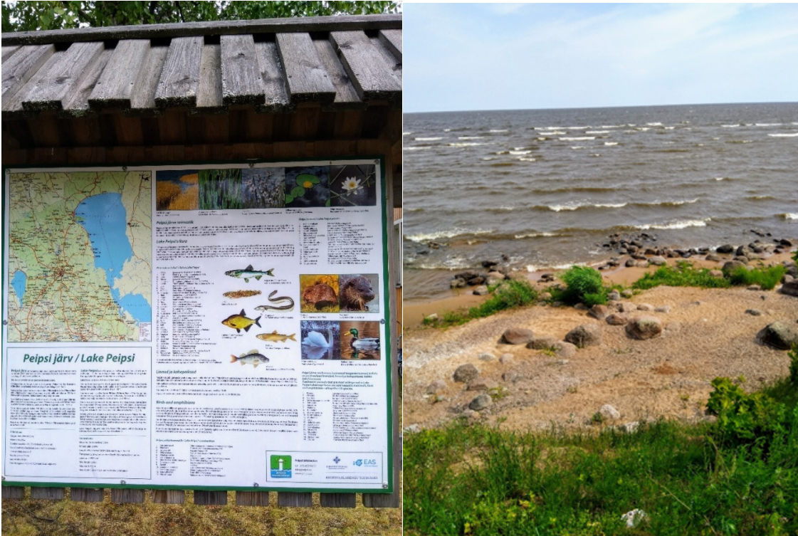
Kallasten devoni-hiekkakivipaljastuman opastaulu ja Peipsjärveä.

Paljastuman pituus on 930 m ja korkeus keskimäärin 2-3 m, korkeimmillaan 9 m. Hiekkakivestä on löydetty 4 lajia kalafossiileja, jotka myös esitellään linkissä 10 .