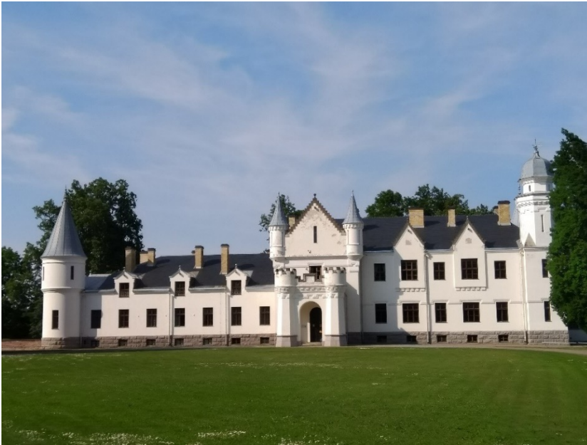
Alatskivi loss (linna) (Linkki 12)

Illallinen oli upeassa Alatskiven kartanossa todella tyylikkäässä, entiseen loistoon restauroidussa salissa. Rakennuksen tyyli on saanut vaikutteita Skotlannista. Kartanoa ympäröi jo kartanon loistoaikana perustettu moision puisto ja hieno järvimaisema.