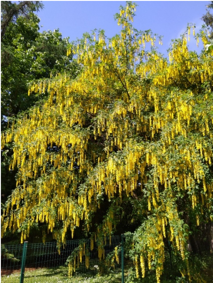
Kultasade ( Laburnum )