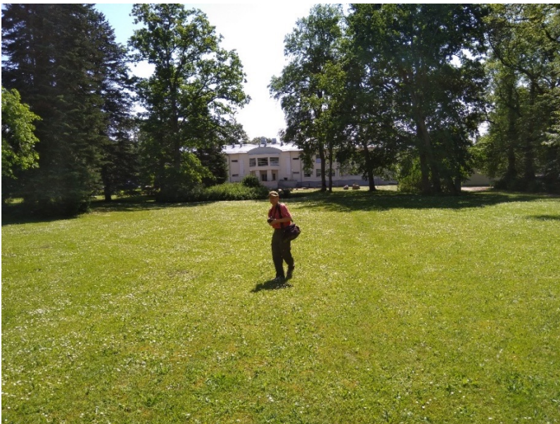
Luuan moision puistoa.

Vanhassa kartanorakennuksessa on nykyisin museo. Opetustilat ovat uudemmassa opistorakennuksessa pihapiirin toisella puolella. (alakuva)