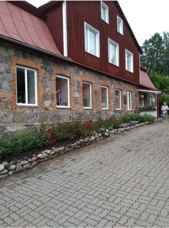
Vooren Lomakeskuksen päärakennus

Illallisen jälkeen tutustuimme ympäristöön. Pihan laatoilta löytyi mm. aika kaunis viinimäkikotilo. Viereisillä niityillä kuulumme yölaulajia; satakieltä, ruisrääkkää ja kerttusia.