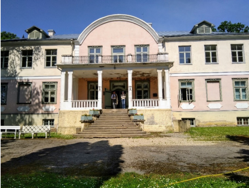
Luuan moision päärakennus.

Sieltä matka jatkui Luuan metsätaloudekouluille, missä tutustuimme sekä teorian opetukseen, mikä suurelta osin tapahtuu tietotekniikkaa käyttäen että varsinaisiin metsäkoneisiin, joista useat olivat suomalaisia Ponsen ja Valmetin koneita. Luuan metsätaloudekoulu on ainoa alansa kouluospaikka Virossa. Sielläkin on jonkun verran ongelmaa saada opetuksen aloituspaikat täyteen, saada opiskelijat pysymään sekä suorittamaan koko koulutuksen tutkintoa myöten.