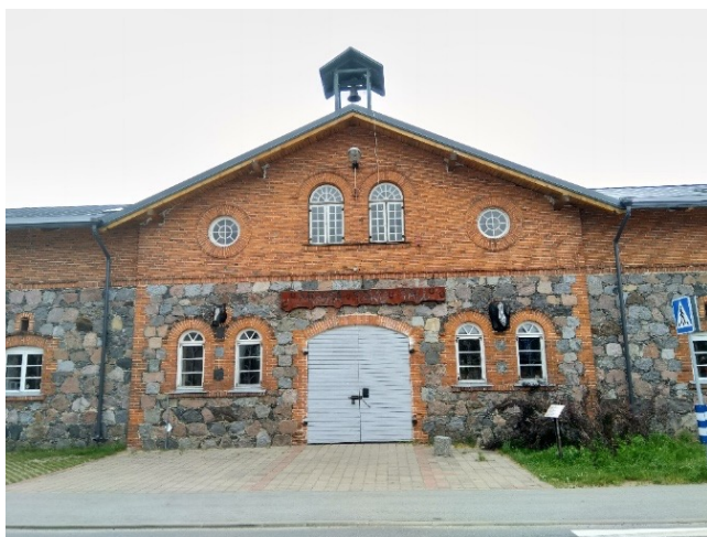
Mustan Oriin Talli Jänedassa