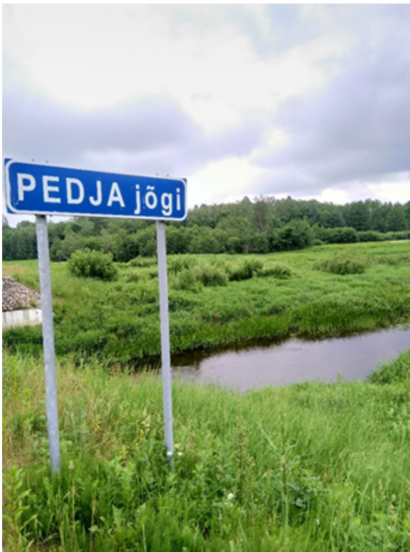
Alam-Pedjan suojelualueen tulvaniittyä.

(Linkki 14) https://fi.wikipedia.org/wiki/Alam-Pedjan_luonnonsuojelualue (FIN)