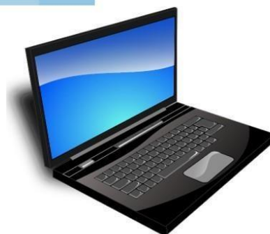
Läppäri kotiin ja joskus mukaan