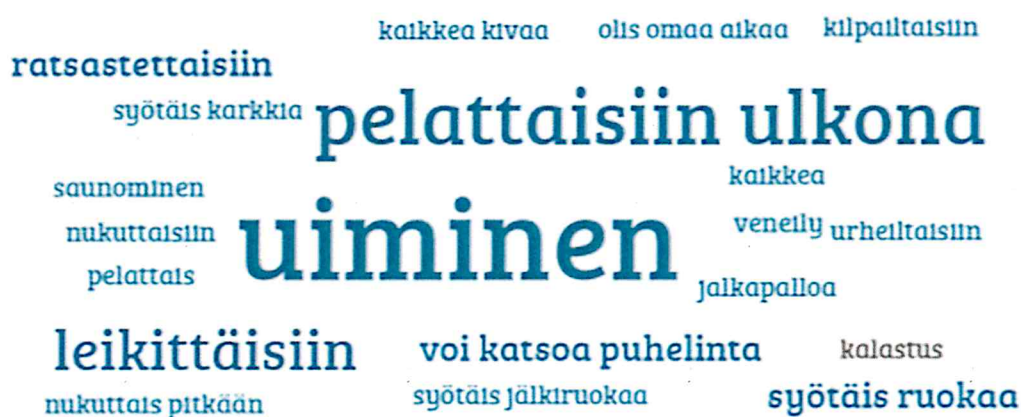
Kuva: 3.-4.-luokkalaisten ajatuksia siitä, mitä unelmien leirillä tehtäisiin. (Fontin koko sanoissa määräytyy vastausten mukaan; mitä isompi fontti, sitä useampi samankaltainen vastaus).

Toivotuin tekeminen unelmien leirillä 3.-4.-luokkalaisilla oli uiminen, ulkona pelaaminen ja leikkiminen. Enemmistö vastaajista kannatti viikon tai 2 viikon leirejä. Osalla toiveissa oli pidemmän aikaa kestävät leirit, osa taas toivoi 2-3 päivän leirejä.