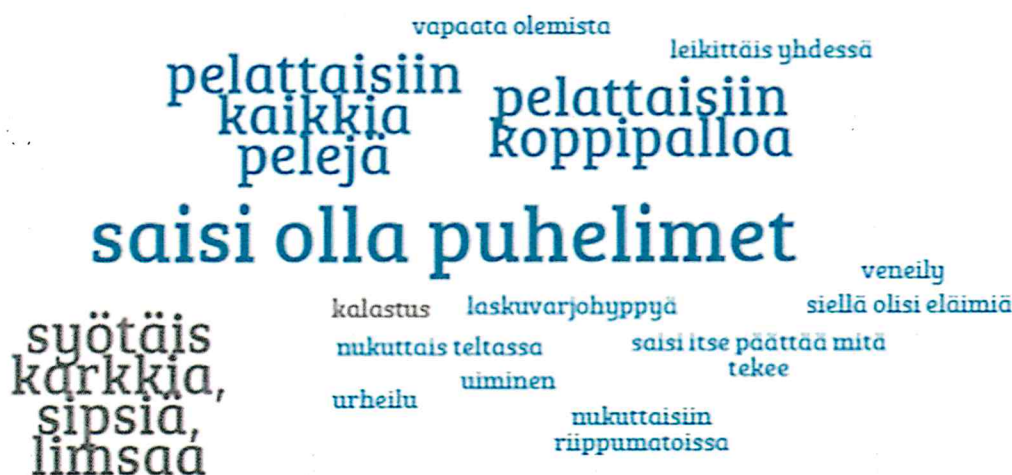
Kuva: 5.-6.-luokkalaisten ajatuksia siitä, mitä unelmien leirillä tehtäisiin. (Fontin koko sanoissa määräytyy vastausten mukaan; mitä isompi fontti, sitä useampi samankaltainen vastaus)

5.-6.-luokkalaisten ”Unelmien leiri” –vastauksissa 5 vastaajaa ajatteli, että unelmien leiri järjestettäisiin Pikku-Liesjärvellä. 2 vastauksessa unelmien leirillä pelattaisiin ja leikittäisiin yhdessä. 3 vastaajaa ajatteli, että leirillä saisi olla käytössä välillä puhelimet ja 2 vastaajista ajatteli, että leirillä syötäisiin herkkuja. Enemmistö vastaajista kannatti viikon tai 4-5 päivän leirejä.