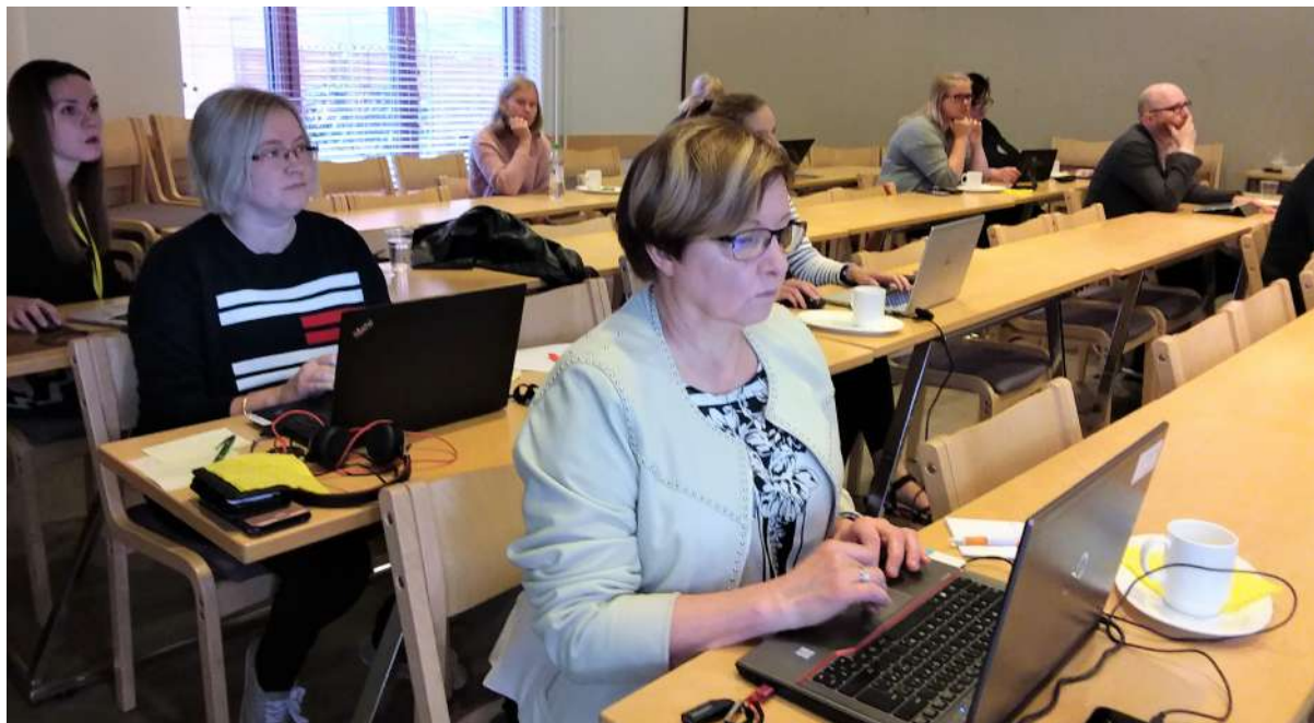
Etelä-Savon ELO-ryhmän jäseniä verkkokokouksessa

Syyskuun 6. päivänä ELYt ja ruotsinkielisen AVIn ELO-yhteyshenkilöt järjestivät ensimmäisen kerran valtakunnallisen yhteisen ELO-ryhmien kokoontumisen etänä sekä suomeksi että osin ruotsiksi. Siihen osallistui 20/21 ELO-ryhmää Suomesta. Tilaisuudesta tuli mainiota palautetta. Aamupäivän yhteisen kokoontumisen jälkeen monet ELO-ryhmät jatkoivat vielä alueellisella tapaamisella.