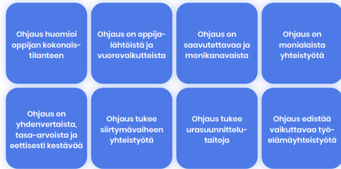
Kuvio 2. Hyvän ohjauksen kriteerit

Ohjauksella on pitkän aikavälin yhteiskunnallisia vaikutuksia. Ohjaus vahvistaa työllisyyttä sekä ehkäisee syrjäytymistä. Onnistuneella ohjauksella on merkittäviä vaikutuksia oppijoiden elämään parantuneiden oppimis-, urasuunnittelu- ja työelämätaitojen kautta.