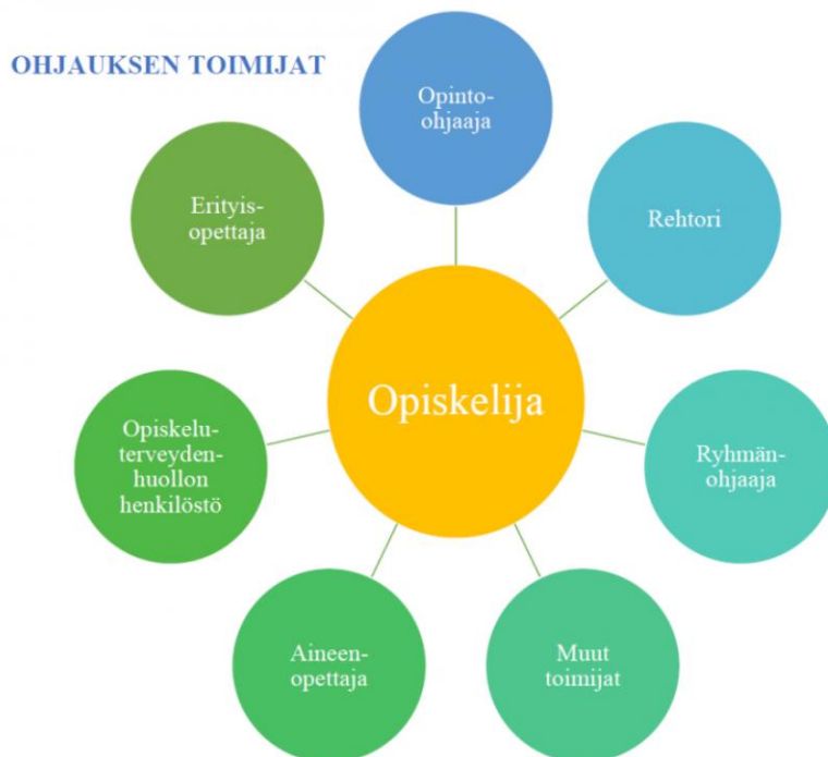
Kuva 1. Ohjauksen toimijat Rautavaaran lukiossa

Rautavaaran lukiossa ohjaukseen osallistuvat opinto-ohjaaja, aineenopettajat, ryhmänohjaaja, rehtori, koulusihteeri, erityisopettaja, koulukuraattori, terveydenhoitaja ja opiskelijakunnan hallitus.