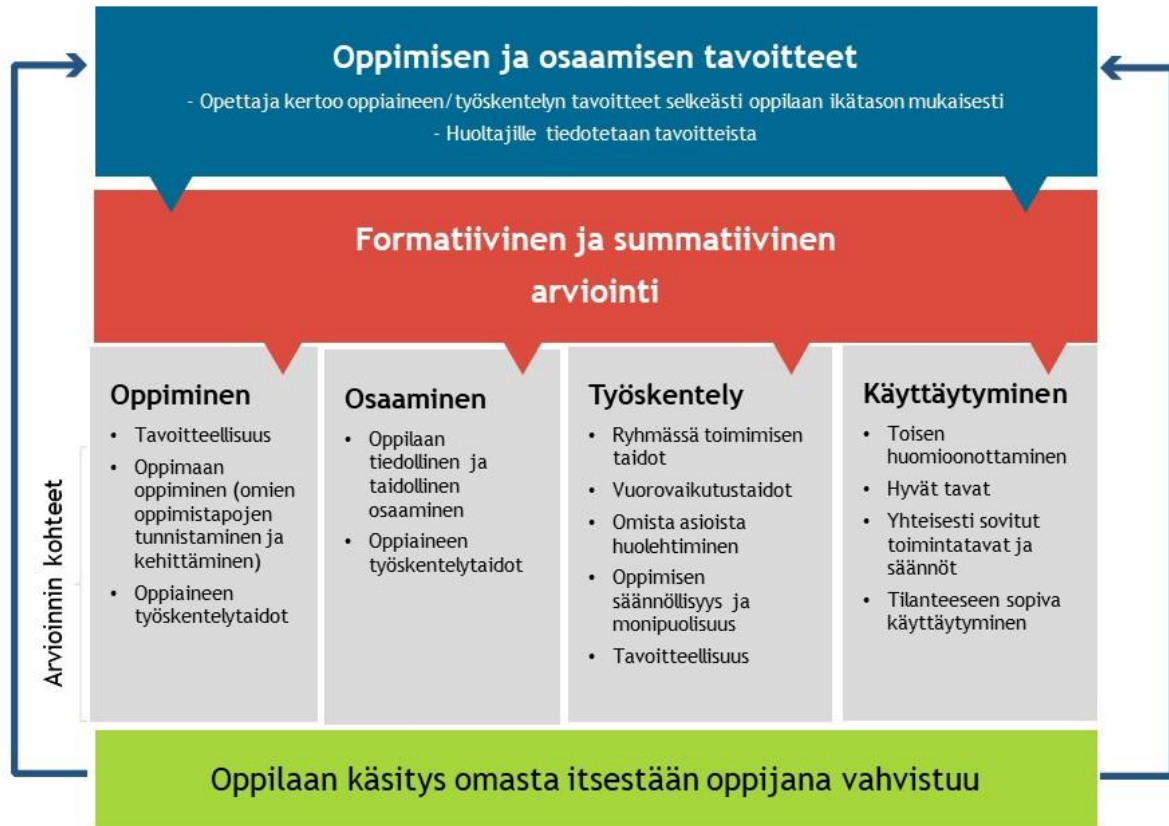
Kuvio 1: Arviointi oppimisprosessin aikana