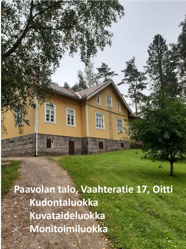
Paavolan talo, Vaahteratie 17, Oitti