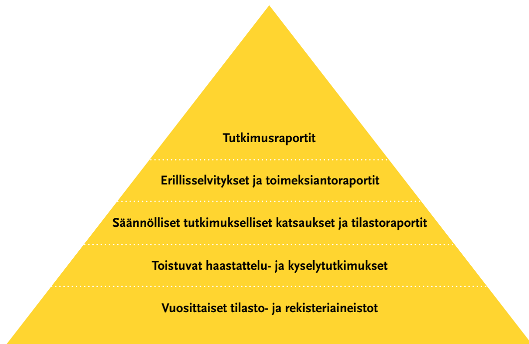
Kuvio 3. Tiedon pyramidi 24

Oheinen tiedon pyramidi kuvaa erilaista johtamisen tukena käytettävää tietoa.