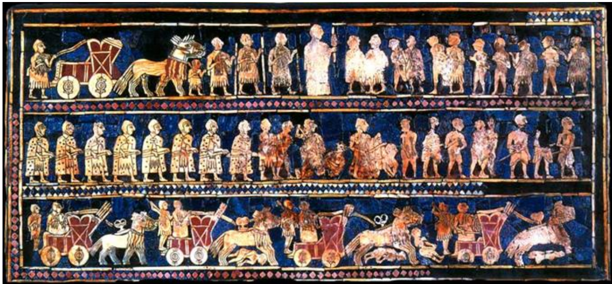
Urin standardi Mesopotamiasta