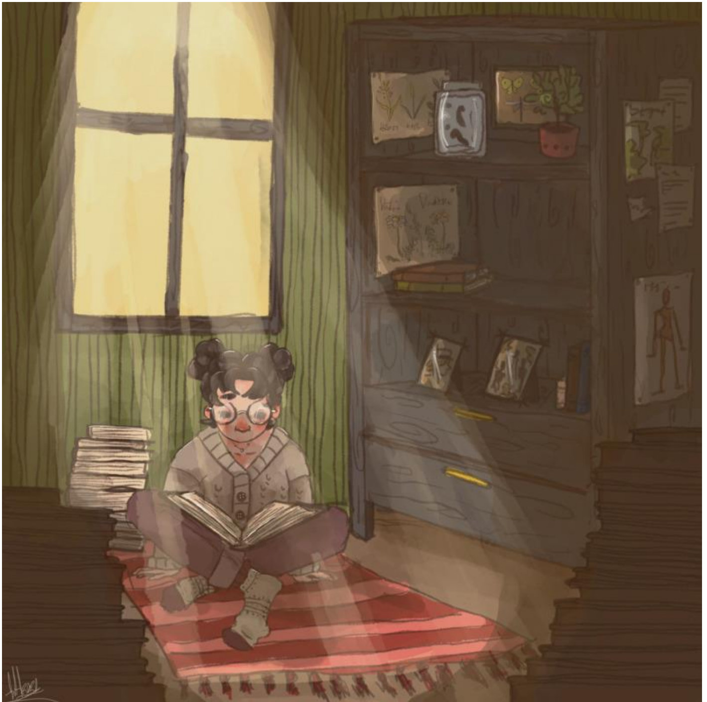
Piirros: Josefiina Huumarkangas