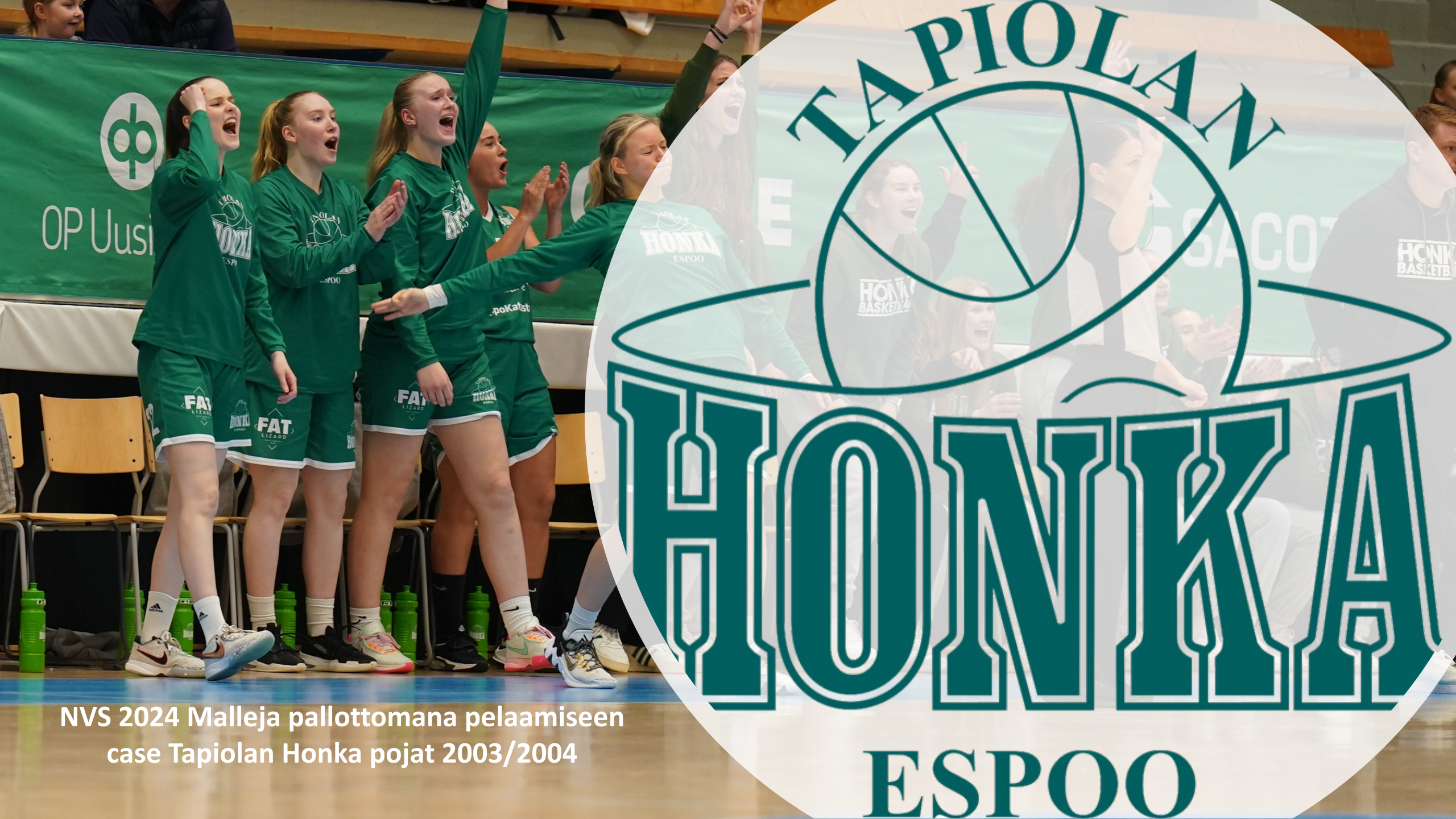
NVS 2024 Malleja pallottomana pelaamiseen case Tapiolan Honka pojat 2003/2004