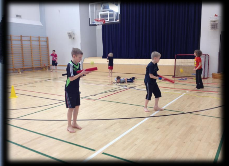
"On hyvä että liikunnassa on myös tietty määrä "perinteisiä" lajeja"