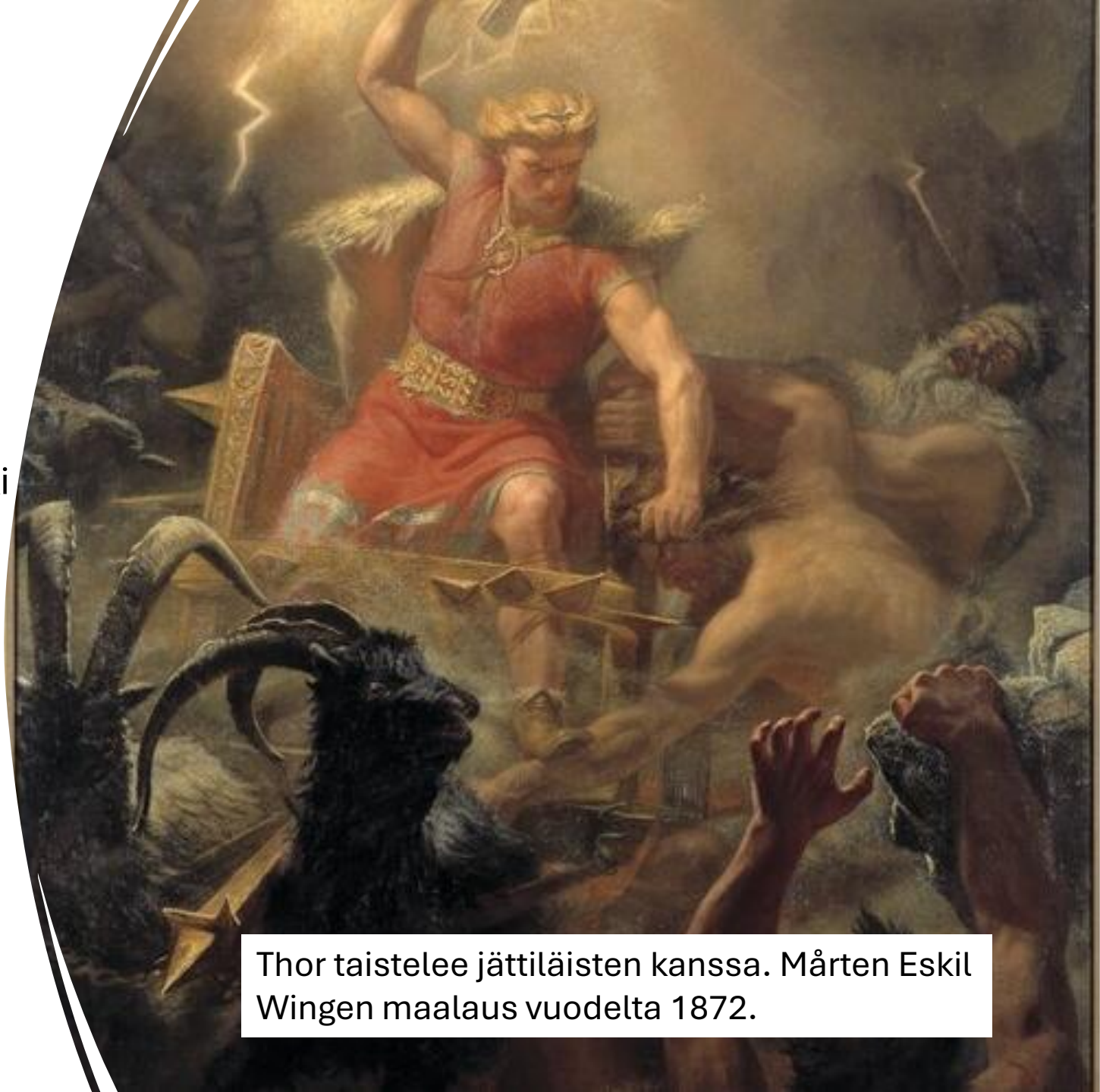
Thor taistelee jättiläisten kanssa. Mårten Eskil Wingen maalaus vuodelta 1872.