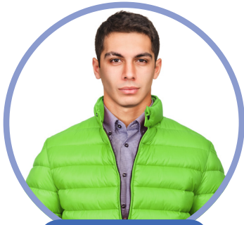
en grön jacka

Ensimmäistä muotoa käytetään en-sukuisia sanoja kuvailtaessa: