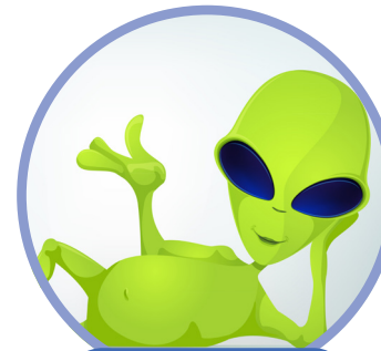
Ja gillar grönt!

Toista muotoa tarvitset myös, kun puhut väristä yleensä.