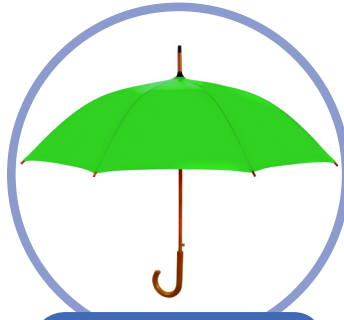
ett grönt paraply

Toinen muoto on käytössä ett-sukuisten sanojen yhteydessä: