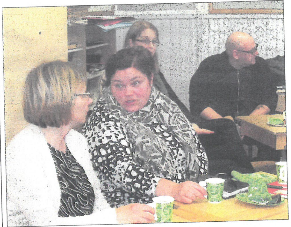
Opettajat kuulolla koulutuksessa yhdysluokkaopetuksesta.

nisaatioista. Kutsu lähetetään myös opettajankoulutuslaitoksiin ja normaalikouluihin. Kutsun saajien toivotaan välittävän sitä henkilöille, joiden uskovat olevan kiinnostuneita pienten koulujen toiminnan ja tutkimuksen kehittamisestä.