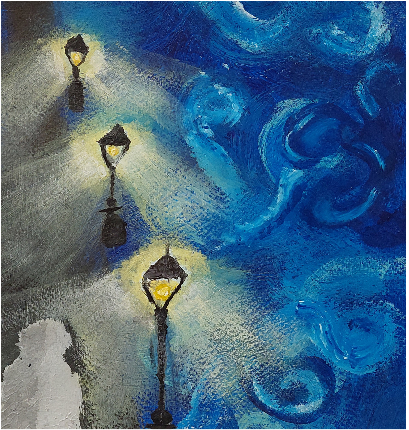
Tuulen huminaa Linus Neumann 2025