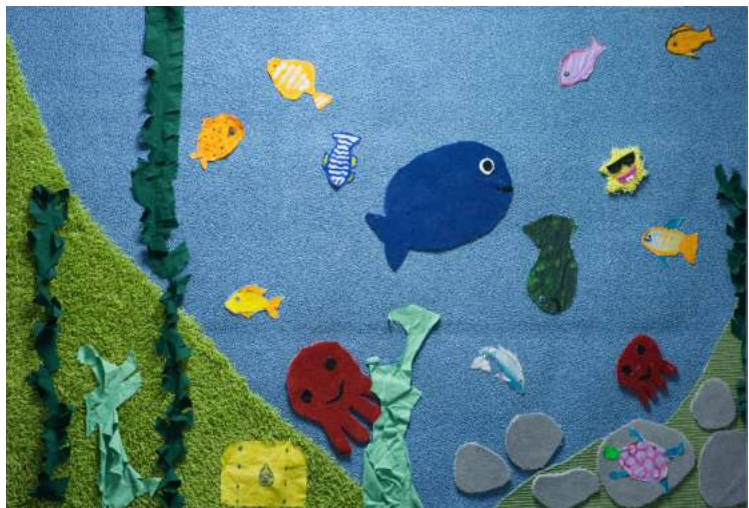
Aulan seinälle ilmestynyttä Meren eläviä esittävää teosta tehtiin yhteistyönä 9lk. käsityön tunneilla.