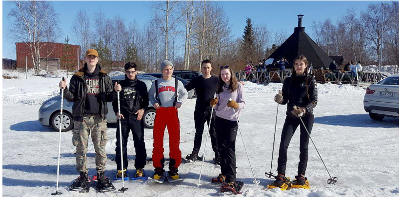
Heidenheimin lukiolaisten ierailuohjelmassa ei ollut pelkästään koulutunteja, vaan tuntumaa otettiin myös talviseen Raaheseen.