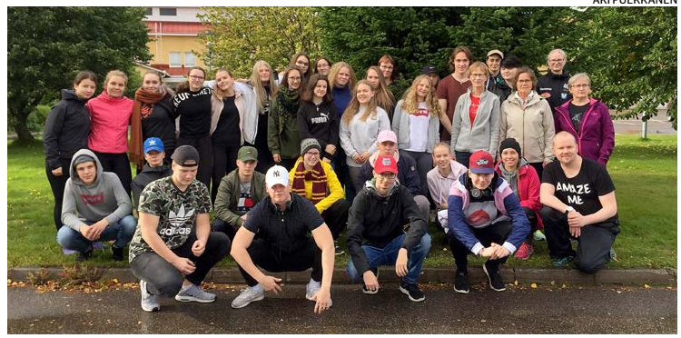
Tiedeleirikoululaiset vierailivat muun muassa Kalajoen meriluontokeskuksessa.