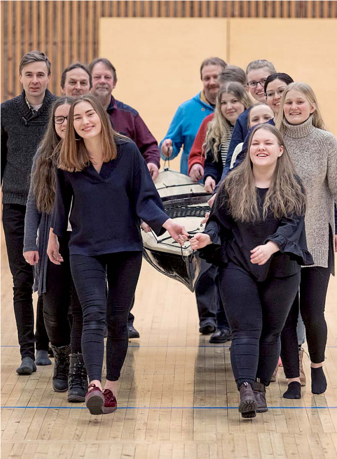
Darana Raahe-Mwanza projektin jäsenet ja apujoukot kantavat yhteisvoimin valmiita kajakkia.