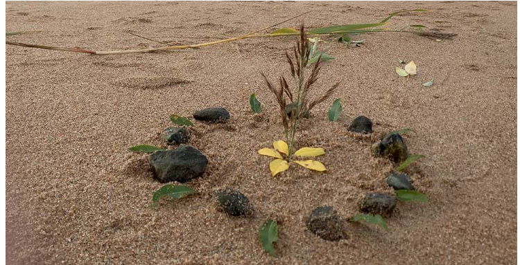
Tiedeleirikoulu yhdistelee tiedettä ja taidetta.