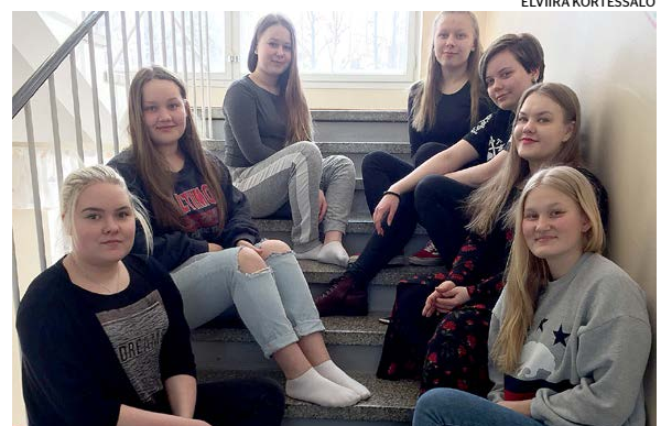
Tutorit tuovat toimintaa lukioala-alueen

Tutorina toimissa saa uusia kokemuksia, ystäviä ja vastuun otta-