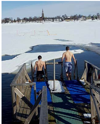
Rohkeimmat uskaltautuivat avantoon.