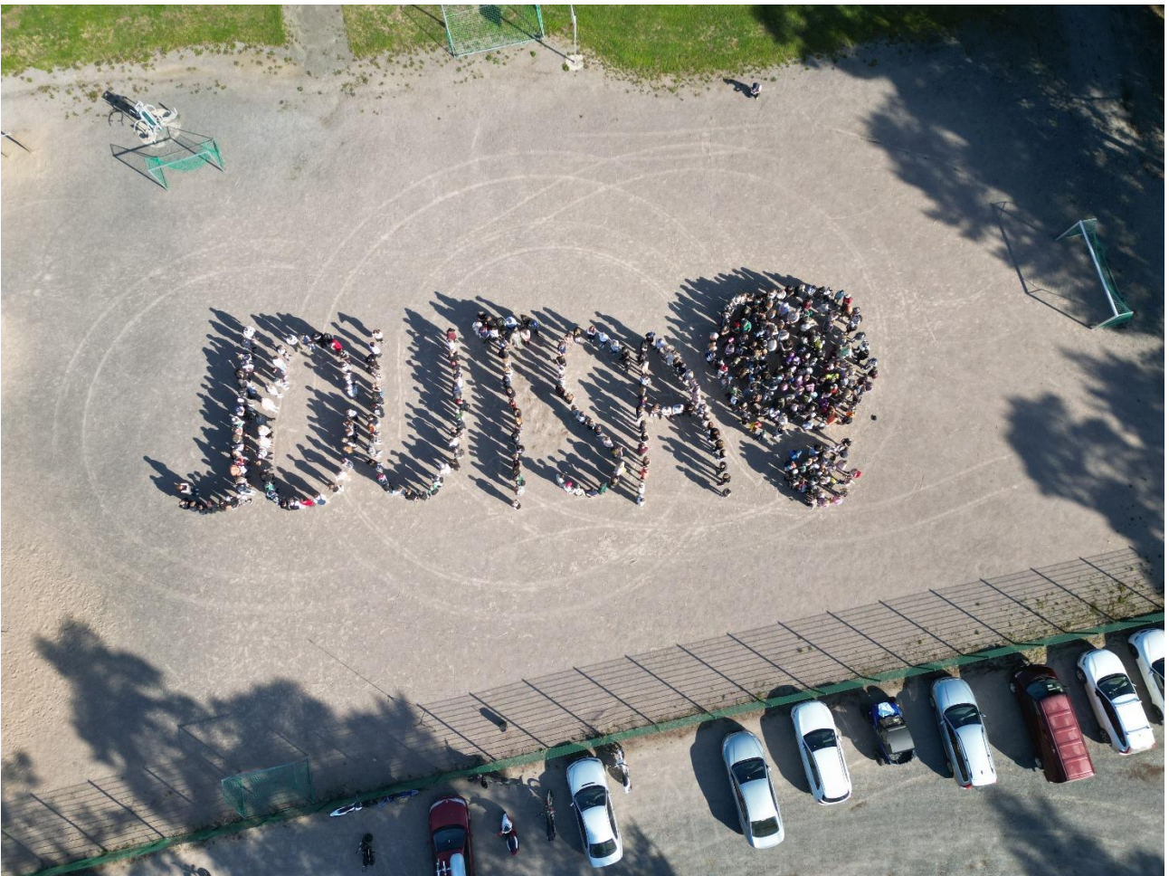
Koulunmäen oppilaat ja henkilöstö ensimmäisenä koulupäivänä syksyllä 2024.

Lukiokursseja pystyttiin jälleen toteuttamaan laajasti ja laadukkaasti. Yhteisten resurssien käyttö yhtenäiskoulun kanssa takasi jokaiseen aineeseen pätevän opettajan. Paikallisina opintojaksoina tarjottiin liikuntavalmennuksen lisäksi kansainvälisyystoimintaa sekä merkittävä määrä lähinnä yo-kirjoituksiin tähtäviä kertauskursseja ja esimerkiksi hyvinvointitaitoja.