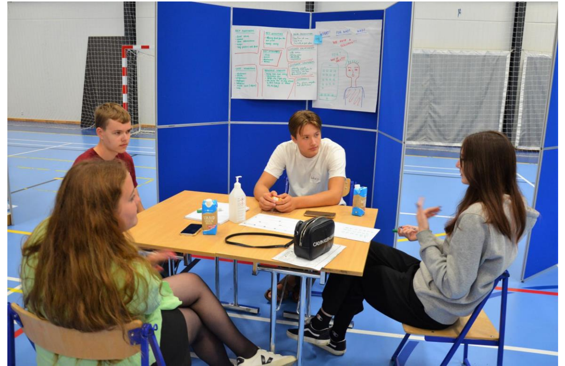
Kestävän kehityksen kansainvälinen työpaja Tanskassa elokuu 2022