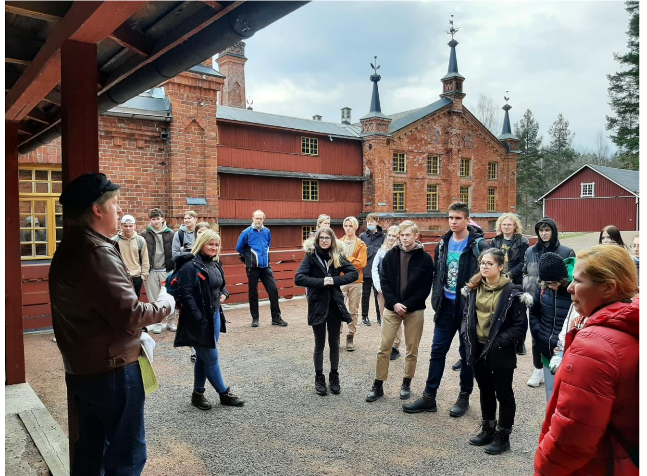
Verlan kohdevierailu 4/2022. Mukana opiskelijoita Kuusankosken lukiosta, Slovakiasta ja Latviasta.