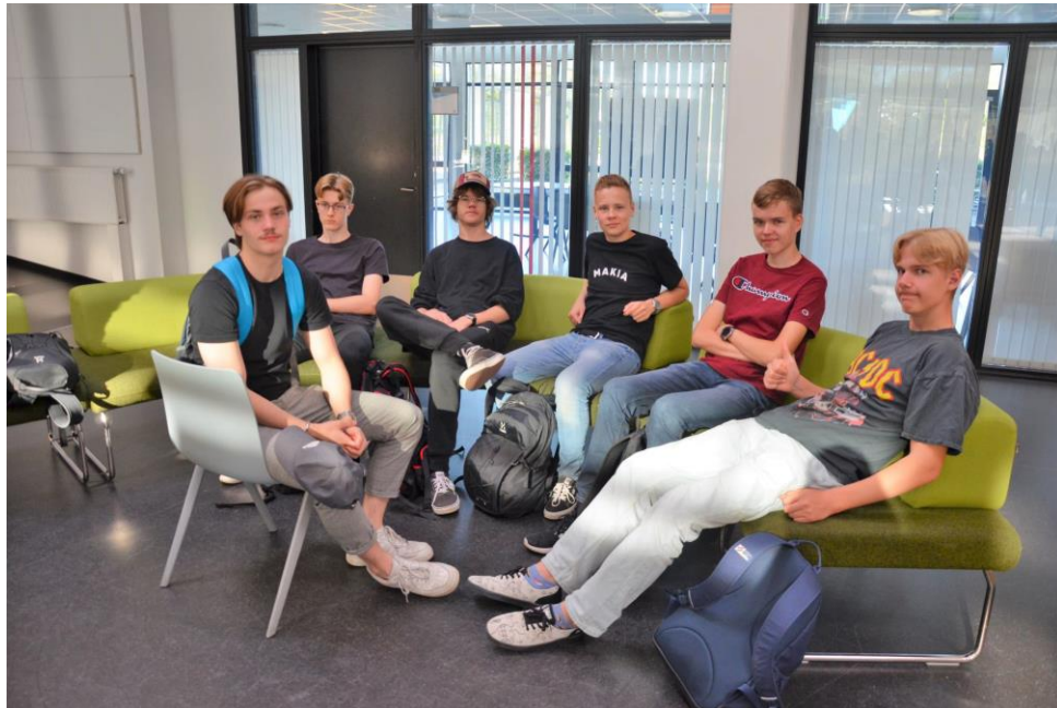
Kuusankosken lukion opiskelijoita ansaitulla tauolla Tanskan kestävän kehityksen opintomatalla

Verkostoon kuuluvat koulut kehittävät ja testaavat innovatiivisia ja osallistavia opetusmenetelmiä, joiden keskiössä ovat rauha ja ihmisoikeudet, kestävä kehitys, maailmankansalaisuus ja kulttuurien välinen osaaminen.