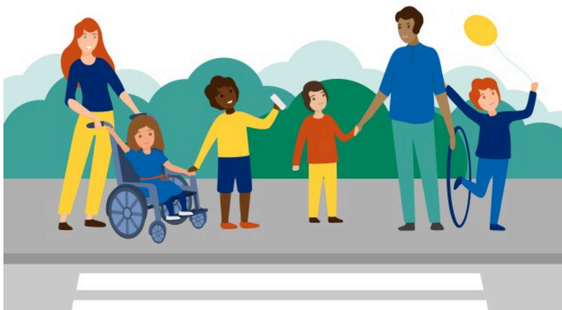
Barngrupp i stadsmiljö

tillsammans med andra barn och vuxna stärker barnens förmåga att delta och påverka. Barnen ska uppmuntras att hjälpa varandra och att vid behov be om hjälp. Det är viktigt att barnen upplever och vet att de som barn har rätt att få hjälp och skydd av vuxna.