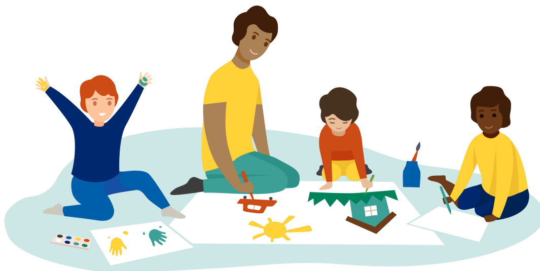
Tre barn och en vuxen ritar och målar tillsammans

I förskoleundervisningen erbjuds barnen möjligheter att prova på mångsidiga digitala arbetsätt, såsom att fotografera och filma samt skapa egna digitala berättelser och animationer. I förskoleundervisningen används också interaktiva skärmar och dokumentkamera som stöd för lärandet. De utnyttjas särskilt för bildstöd, för att konkretisera innehåll samt för att skapa smidighet i vardagen och levandegöra verksamheten (till exempel med hjälp av ljud och rörelse). Åbos digitala stigar styr utvecklingen av digitala färdigheter i förskoleundervisningen: medieläskunnighet, programmeringskompetens samt informations- och kommunikationsteknisk kompetens Förskola – Turun digipolut