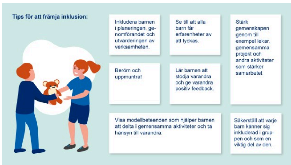
Tips för att främja inklusion

I förskoleundervisningen sker verksamheten flexibelt i grupper av varierande storlek, där både grupper och personal kan variera. Grupperna bildas utifrån pedagogiska grunder så att barnen får möjlighet att öva på att fungera både i små grupper och i större grupper. Undervisningen genomförs som samundervisning.